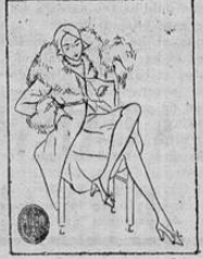
La suprema elegancia femenina